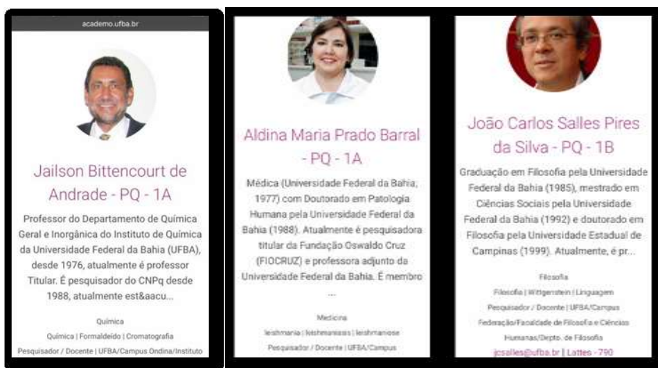
Figura 2: App Academo : Investigadores/as PQ 1A y PQ1B