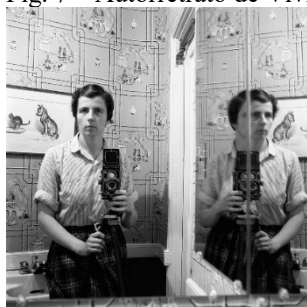
Fig. 7 – Autorretrato de Vivian Maier