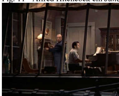
Fig. 11 - Alfred Hitchcock em Janela Indiscreta