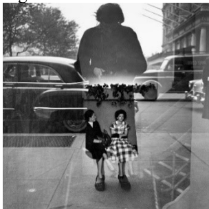
Fig. 5 – Autorretrato de Vivian Maier