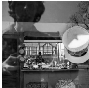
Fig. 8 – Autorretrato de Vivian Maier