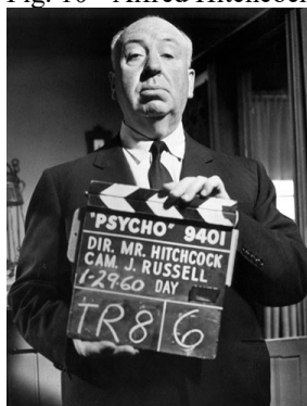
Fig. 10 - Alfred Hitchcock em Psychose