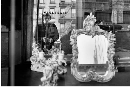
Fig. 3 – Autorretrato de Vivian Maier