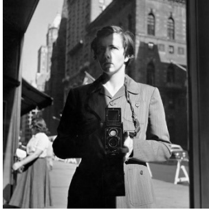
Fig. 4 – Autorretrato de Vivian Maier