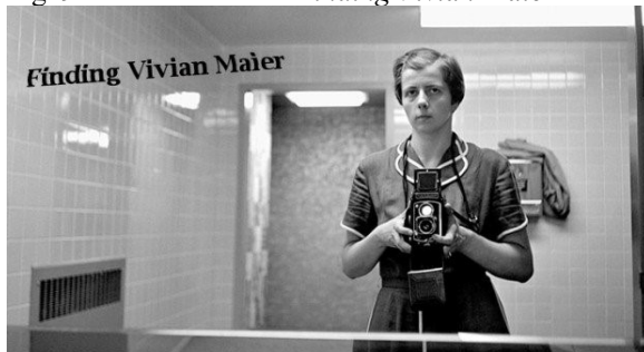
Fig. 9 – Frame do filme Finding Vivian Maier

Na fotografia de Vivian Maier estão evidentes tanto um elemento racional (a comprovação de sua imagem, que demonstra que ela existiu como fotógrafa) quanto “o onírico e o lúdico, a fantasia, o imaginativo, o afetivo, o não-racional, o irracional, os sonhos, enfim, as construções mentais potencializadoras das chamadas práticas”, como destacou Maffesoli (2001, p. 77). O criador da imagem capta “o que circula na sociedade”, de forma que sua criação corresponde a “uma atmosfera” (2001, p. 80), dá forma ao informal ou disforme . Tanto o cinema quanto a fotografia trabalham “com arquétipos, em sintonia com o que está enraizado, vivido no social” (p. 80). A imagem, o cinema, entram “em sintonia com o espírito coletivo” e conforme Maffesoli, “são tecnologias do imaginário que bebem em fontes imaginárias para alimentar imaginários” (p. 80).