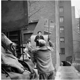
Fig. 1 – Autorretrato de Vivian Maier