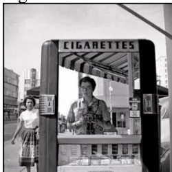
Fig. 2 – Autorretrato de Vivian Maier