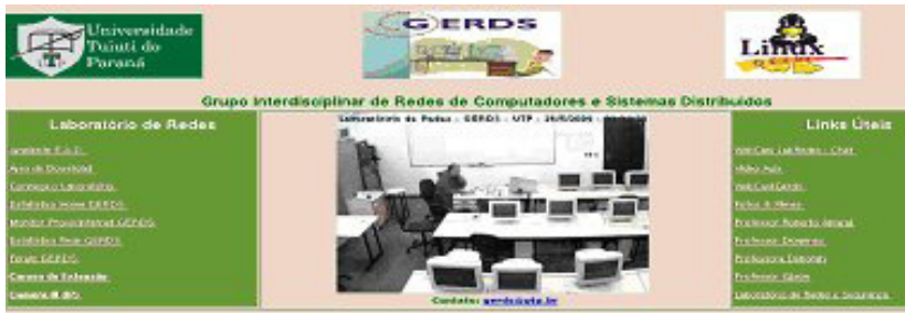
Figura. 3) Página inicial do portal GERDS ( http://gerds.utp.br/ ).

Com o apoio da infraestrutura implantada no laboratório de redes (GERDS - Grupo Interdisciplinar de Redes de Computadores e Sistemas Distribuídos - http://gerds.utp.br/ ) a integração entre o hardware (robôs, câmeras, etc.) e a rede foi concluída. Algumas funcionalidades já apresentam resultados e podem ser testadas na página do GERDS no link “Câmera III (IP)” (figura 3). A