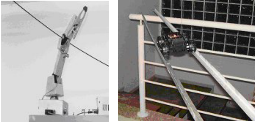
Figura. 2) Sistemas robóticos implementados.

Com o apoio da infraestrutura implantada no laboratório de redes (GERDS - Grupo Interdisciplinar de Redes de Computadores e Sistemas Distribuídos - http://gerds.utp.br/ ) a integração entre o hardware (robôs, câmeras, etc.) e a rede foi concluída. Algumas funcionalidades já apresentam resultados e podem ser testadas na página do GERDS no link “Câmera III (IP)” (figura 3). A