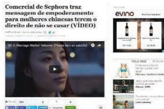
FIGURA 2 - Matéria do HuffPost Brasil com destaque para o vídeo.

Por outro lado, no Facebook Live , transmissões ao vivo pela fan page do jornal são realizadas quando o veículo pretende dar informações de última hora ou expandir a discussão sobre um tema, sendo o maior foco no cenário econômico e político, por exemplo o caso do impeachment (Figura 5), remetendo à questão