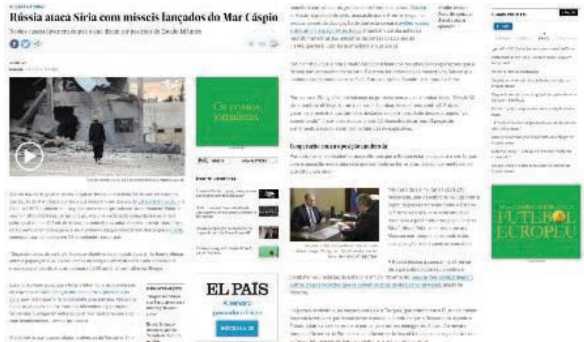
FIGURA 12 - Reportagem contém ligações entre elementos internos e outras publicações do site.

No período observado, entre agosto e setembro de 2015, o VNBr não apresentou características fortes de imediatividade ou instantaneidade (Bradshaw, 2014), por vezes tendo períodos sem nenhuma publicação, fato que se justifica, talvez, pela tendência a seguir pautas diferenciadas ou que tratem de assuntos relevantes sob outro enfoque, grande parte até mesmo sendo traduzida do site em inglês. Esse traço é definidor de sua identidade na edição local, mais voltada para a diversificação e o detalhamento das notícias do que