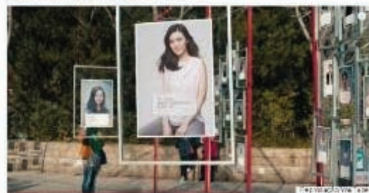
FIGURA 3 - Destaque da matéria com imagem ilustrativa e reprodução textual de mensagens da campanha.

Elas trocaram os anúncios feitos pelos seus pais por fotos delas mesmas e mensagens replicando como toda essa pressão se vivencia.