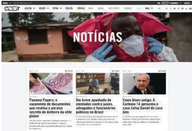
FIGURA 14 - Home do Vice News Brasil, com apresentação de notícias em colunas, porém sem diferenciação visual de qual seria mais importante.