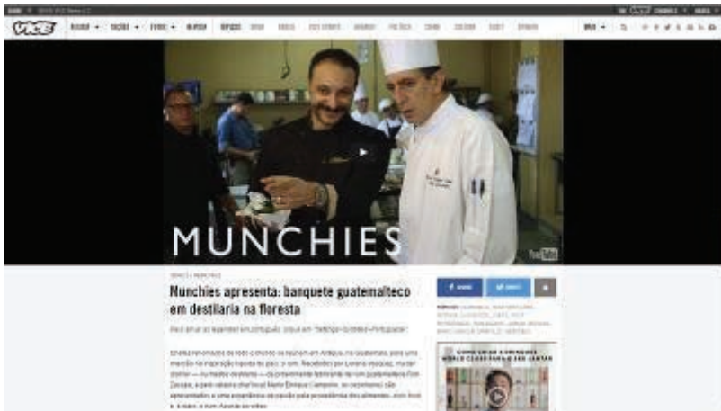
FIGURA 16 - Página exclusiva para exibição de produto audiovisual.

propriamente ao caráter de contínua atualização dos meios online . Como mencionado anteriormente no discurso de fundação, o veículo tem um público jovem, e para que possa alcançar tal objetivo, o VNBr faz uso de uma linguagem (Bertocchi, Camargo e Silveira, 2014) que remete ao estilo presente em blogs , ou seja, traz estilo mais livre, frequentemente recorrendo mais a imagens (estáticas e em movimento) para transmitir a informação. Novamente, o hipertexto (Canavilhas, 2014) é encontrado como forma de ligação entre blocos informativos, possibilitando a leitura de formas diversas, sem contanto influenciar o entendimento geral.