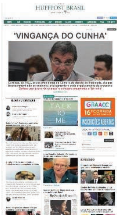
FIGURA 1 - Página inicial do HuffPost Brasil, com destaque para a notícia de maior importância naquele momento.