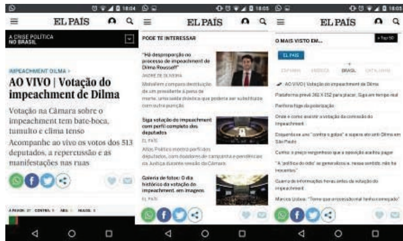
FIGURA 13 - Versão móvel do site do El País Brasil, que segue o modo de exibição das notícias de acordo com seu grau de importância no momento.