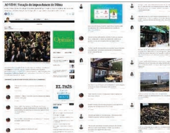
FIGURA 11 - Live blogging da votação do impeachment da presidente Dilma.