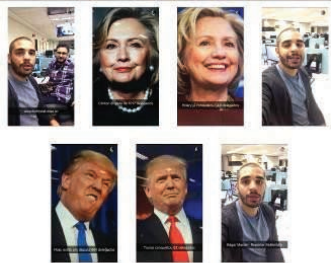
FIGURA 4 - Informações preliminares sobre as disputas da Super Terça, através do aplicativo Snapchat.

da instantaneidade/imediaticidade de distribuição e consumo dos fatos (BRADSHAW, 2014).