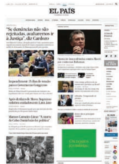
FIGURA 8 - Home do El País Brasil, onde as matérias são apresentadas de acordo com o grau de importância da temática principal.

Com layout semelhante ao do HuffPost Brasil, porém com algumas pequenas alterações, o El País Brasil divide a página em três faixas (Figura 8), com a