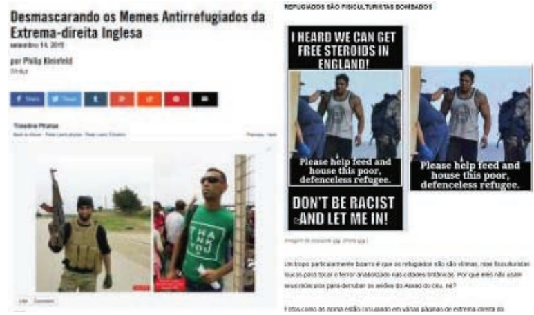
FIGURA 15 - Reportagem busca nos sites de redes sociais material para agregação de valor informativo.