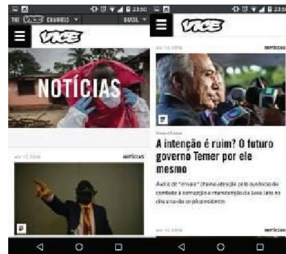
FIGURA 17 - Site móvel do Vice News Brasil.

Quanto ao El País Brasil , o jornal cumpre sua função de ser um meio que se manifesta de forma a produzir efeito de sentido de objetividade e neutralidade, sem se deixar influenciar por questões políticas, possivelmente por ter sido instalado no País pelo grupo de comunicação original, e não em parceria com empresas nacionais. No entanto, como dito anteriormente, a linguagem narrativa aparenta ser predominantemente guiada pelo estilo jornalístico impresso. No que tange à questão das múltiplas plataformas, ainda se faz necessária uma ampliação, especialmente em direção à disponibilização da versão em português nos aplicativos para aparelhos móveis, tendo em vista que, cada vez mais, a informação se