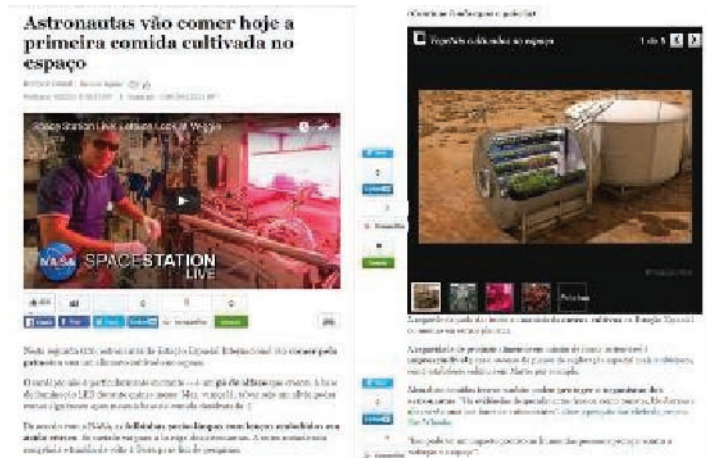
FIGURA 6 - Ligação entre blocos informativos e utilização de linguagem própria de sites de rede social em notícia do HPBr.

limitados aos sites de redes sociais (Twitter e Facebook), são características que chamam a atenção nas publicações do HPBr, como pode ser observado na Figura 6.