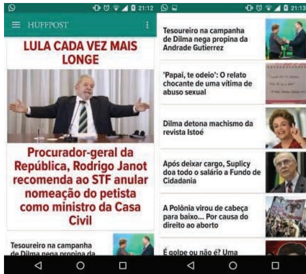
FIGURA 7 - Home do aplicativo HPBr para smartphones e tablets, com apresentação da matéria principal em destaque, seguida pela listagem de outras notícias.

Por último, a ubiquidade (PAVLIK, 2015) do HPBr, percebida pelos diversos ramos do veículo em outros 15 países além de sua matriz, permite o acesso por meio de outros dispositivos que não somente o computador, mas também smartphones e tablets , com adaptação da forma do conteúdo, por meio de atualização no momento em que a matéria é publicada na base principal ( site ).