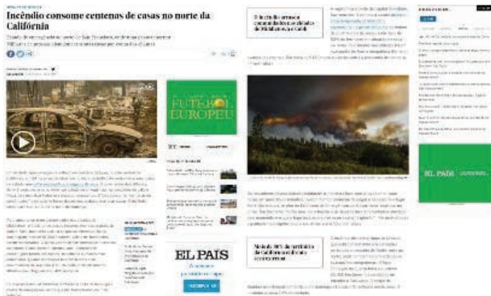
FIGURA 9 - Notícia de incêndio com vídeo, imagem e links que possibilitam acesso a mais informações sobre o acontecido.