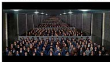
Figura 3 – Alinhamento escolar e processo de subjetivação

No século XVIII, as ordenações por fileiras começam a dividir o corpo discente de forma a organizar a escola em arranjos, surgindo as filas para entrar na sala, sair da sala, filas no corredor, no pátio, por séries, por idade etc. É este conjunto de alinhamentos, onde os alunos ora ocupam uma fila, ora outra, que marca as hierarquias do saber e do poder na instituição escola. Seguindo essa lógica, a escola faz parte de uma rede produtiva que age sobre o corpo social, não somente como poder repressivo, mas, principalmente, como dispositivo de produção de subjetividades. Essa característica da escola foi, recentemente, retratada em filme de Roger Waters, como se vê na Figura 3. Essa lógica disciplinar, no entanto, ultrapassa o contexto escolar e dissemina-se por todo o corpo social, afetando o processo de constituição do próprio sujeito.