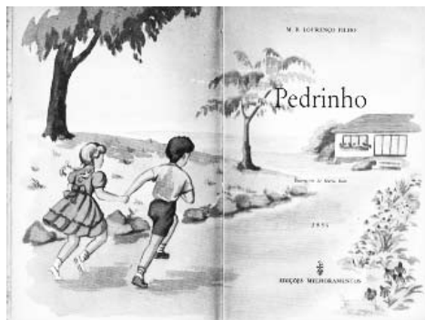
Figura 3: Página de rosto do livro I: Pedrinho.

escola, nesse percurso há árvores, arbustos e flores: a metáfora da escola como uma estrada florida que conduz ao saber e á luz! As descrições importantes presentes na página de rosto são: o nome do autor no alto, o nome do livro, o nome da ilustradora - Maria Boes.