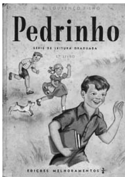
Figura 2: Capa do livro I: Pedrinho.

Na página de rosto (figura 3) há uma nova ilustração, que mostra Pedrinho e Maria Clara correndo de mãos dadas rumo a