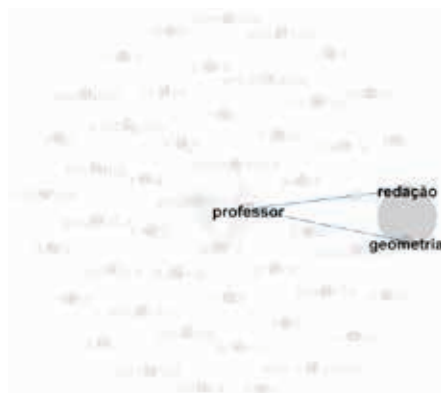
Figura 8: Rede das disciplinas ou áreas