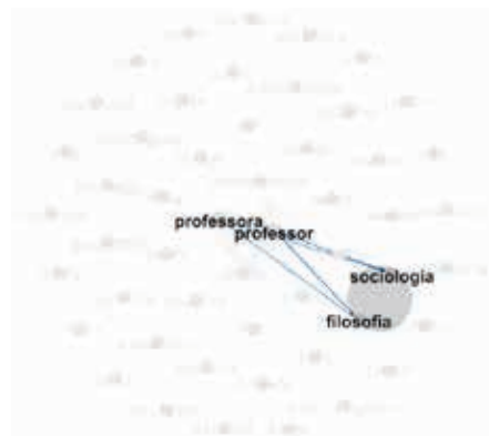
Figura 6: Rede das disciplinas ou áreas

É interessante perceber que os termos representados na figura de nº 06, aludem às disciplinas da grade curricular, presentes no ensino médio e/ou superior, podendo indicar assim, nestes casos, que a atuação do professor seja mais intensa nesses níveis de ensino, do que no nível fundamental. Tal ideia se confirma pela ocorrência do termo "ciências" que não apresenta conexão com o conceito masculino do docente, verificado na representação da figura de nº 03, sendo que o termo "ciências" é um termo mais referente à disciplina do ensino fundamental.