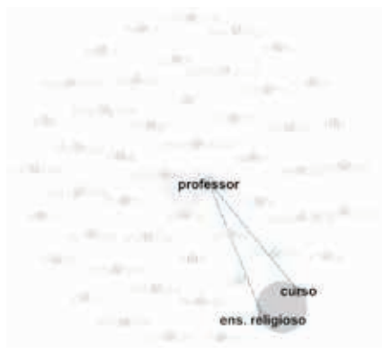
Figura 7: Rede das disciplinas ou áreas Fonte: Elaborada pelo autor/Gephi

Prosseguindo com as figuras 7 e 8, nelas estão descritos os termos das disciplinas representando os "nós" e conexões relacionados com os termos centrais "professora" e "professor".