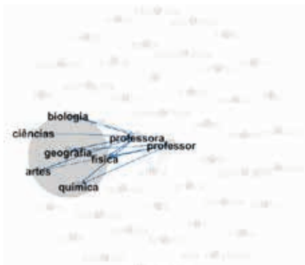
Figura 3: Rede das disciplinas ou áreas

Em seguida, notam-se as redes das figuras 3 e 4, que representam os termos das disciplinas ou áreas de conhecimento com a representação dos "nós" e suas conexões com os termos centrais da estrutura.