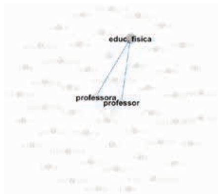
Figura 5: Rede das disciplinas ou áreas