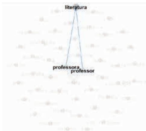
Figura 9: Rede das disciplinas ou áreas

Na última figura 9, está representada a disciplina de "literatura" e os termos centrais da rede "professor" e "professora".