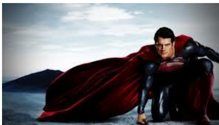
Fig.1 – frame do filme O homem de aço