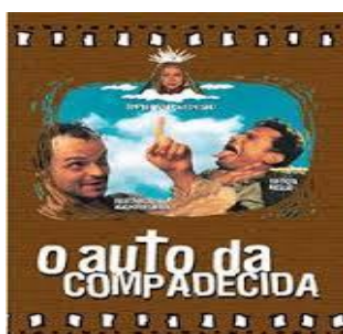
Fig. 4 – Ilustração de capa