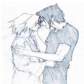
Fig. 3 – Desenho livre