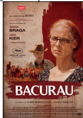
Figura 1 – Capa do filme Bacurau